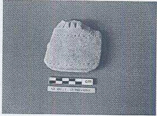
Ejemplar del Tipo Cerámico Rosa Punzonado

Zoila Yolanda Calderón Santizo Zoila Yolanda Calderón Santizo